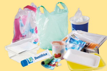
Tous les autres emballages en plastique et polystyrène : films, pots de yaourt, sacs, barquettes...