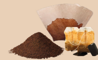
Thé, café et filtres