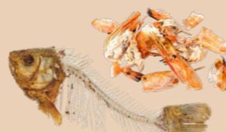
Arêtes, restes de poisson et fruits de mer sans coquille