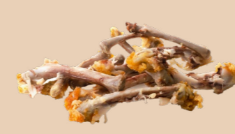
Os et restes de viandes crues ou cuites