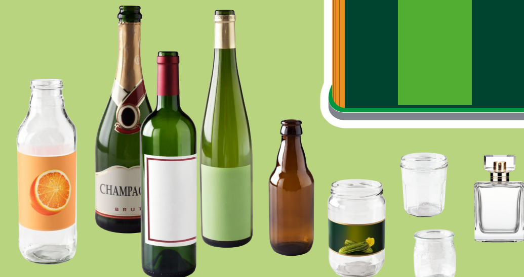
Pots, bocaux, bouteilles et flacons en verre.