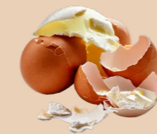
Produits laitiers, œufs, contenu des yaourts, fromages