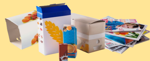
Briques alimentaires, emballages en carton et papiers, revues et magazines