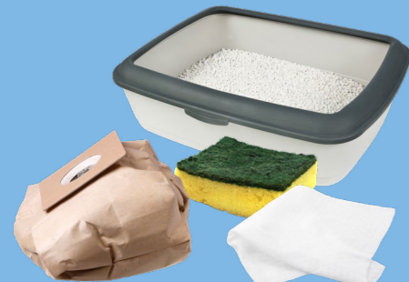
Lingettes, éponges, sac aspirateur, litière...