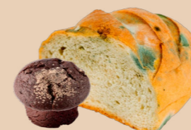
Pain et pâtisseries