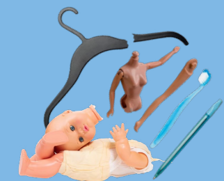
Petits objets cassés