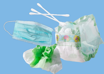
Déchets d'hygiène (mouchoirs, couches, masques, protections périodiques...)