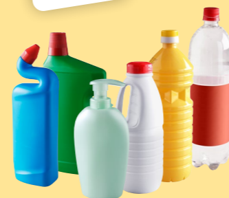
Bouteilles, bidons et flacons en plastique