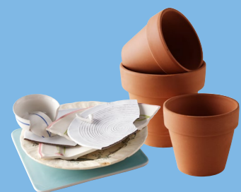
Vaisselle, céramique, pot en terre cuite...