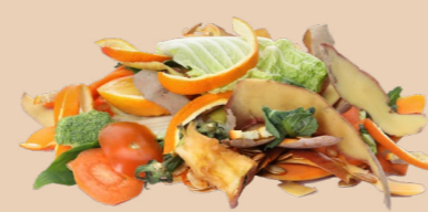
Fruits, légumes et leurs épluchures